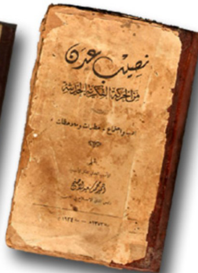
أحمد محمد سعيد الأصبج. نصيب عدن من الحركة الفكرية الحديثة القاهرة - مطبعة الشوري 1934